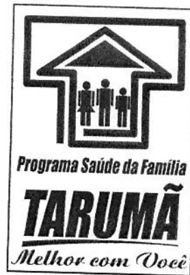
Programa Saúde da Família